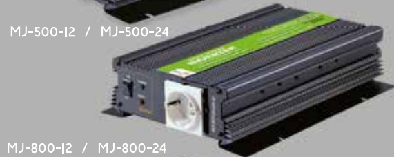
MJ-800-I2 / MJ-800-24