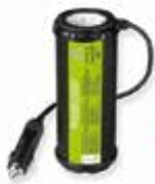
MJ-150-I2-R Con cargador USB