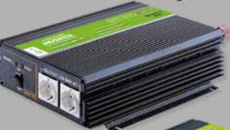
MJ-1200-I2 / MJ-1200-24