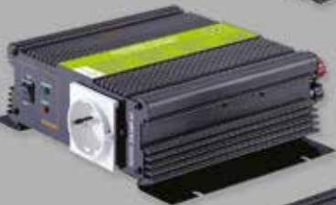
MJ-500-I2 / MJ-500-24