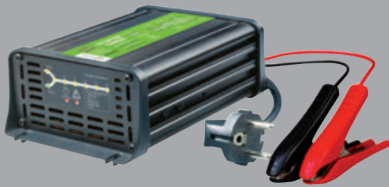
DBC™ - XUNZEL

Cargador de baterías automático de 7 etapas y digital