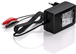
DBC1201LFPB 18W 12V Cargador Universal de Baterías