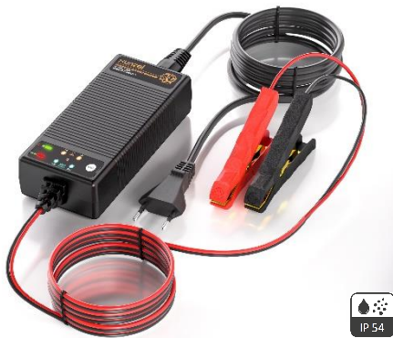
DBC12406LFPB 100W 12V y 24V Cargador Universal de Baterías