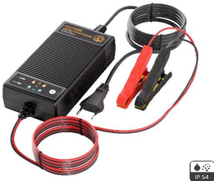
DBC12410LFPB 150W 12V y 24V Cargador Universal de Baterías