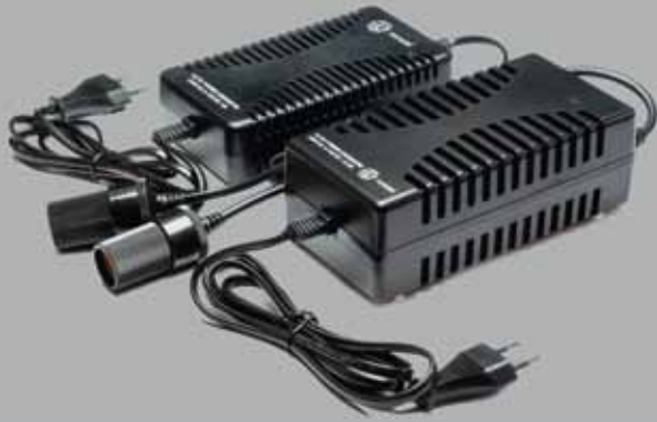
ACDC TM Series - XUNZEL