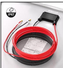
incluye 4m cable (2-cables)